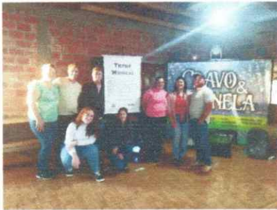
05/07/2025 Matinê Entidade APMF E. M. Bom Jesus;