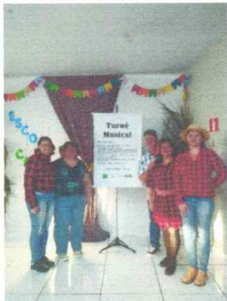
10/07/2025 Matinê entidade dos idosos;